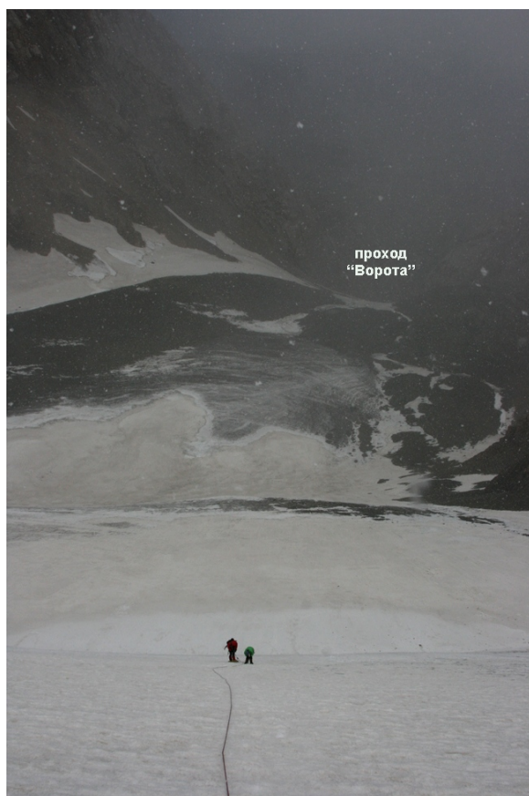
7. В верхней части маршрута