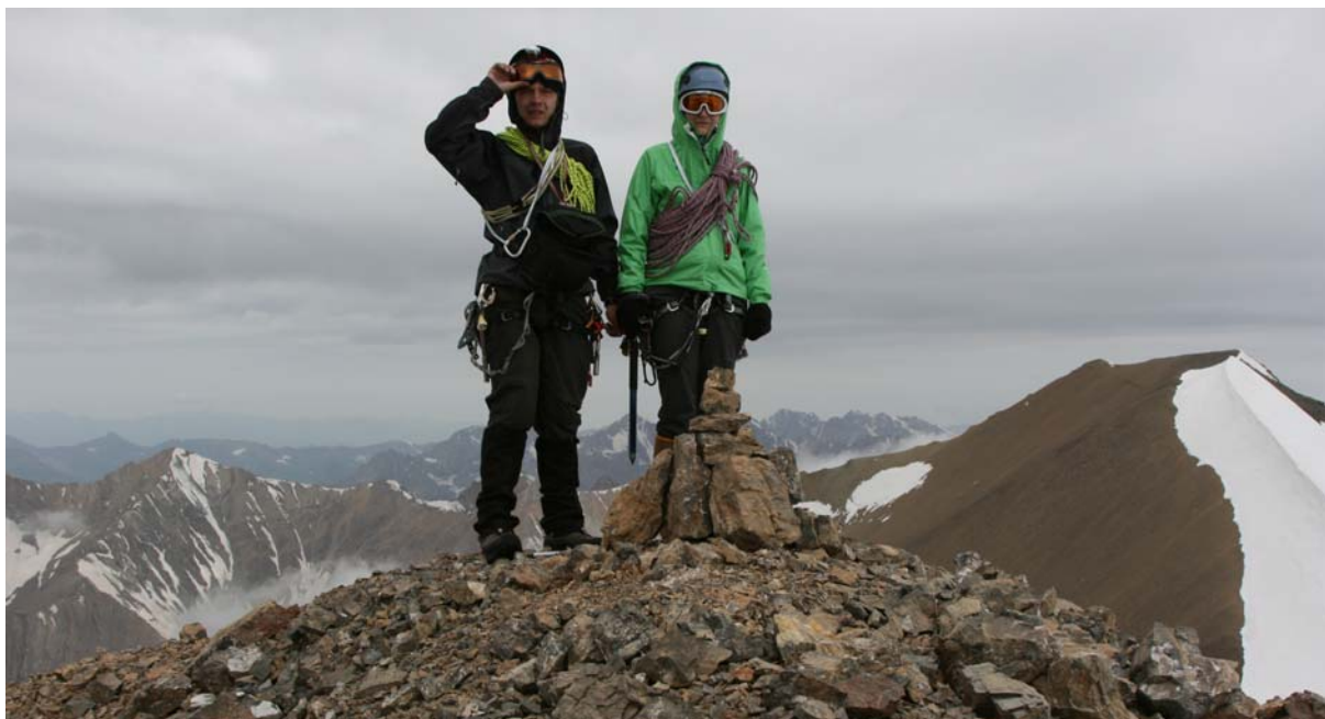
9. Вершина. На ЗП справа – Чонташ Западный. Снято 05.07.2007