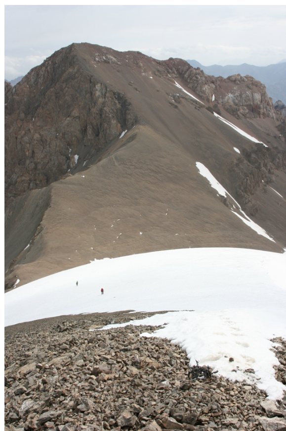
8. Предвершинный гребень