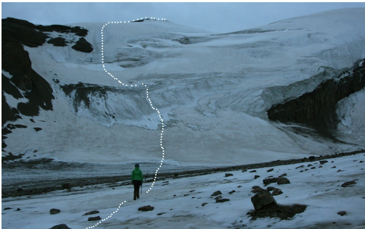
6. Снежно-ледовый взлет. Вторая ступень. Снято 05.07.2007