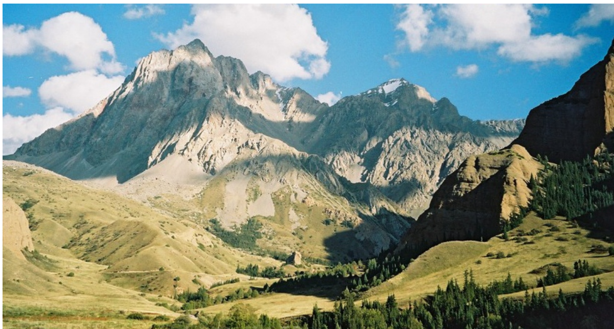
3. Массив Чонташ, вид с северо-запада, из долины ручья Кыз-Коргон. Снято в сентябре 2005