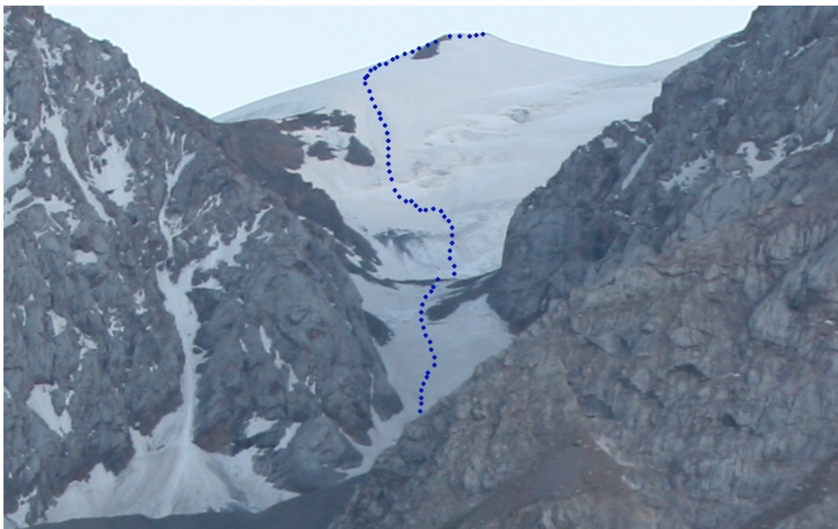
4. Вид с севера. Снято 03.07.2007