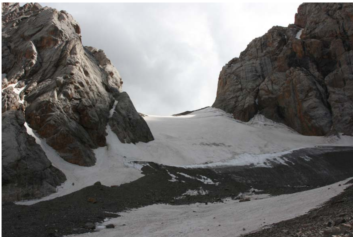
5. Нижняя часть: "Ворота". Снято 04.07.2007