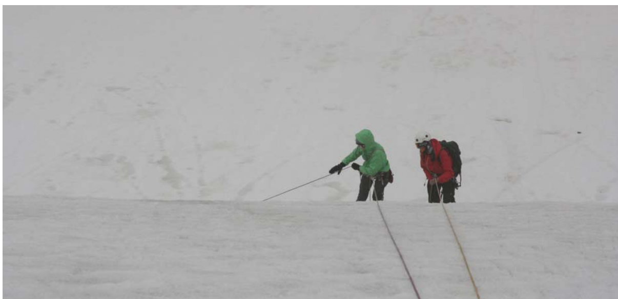
10. Дюльфер на спуске. Снято 05.07.2007